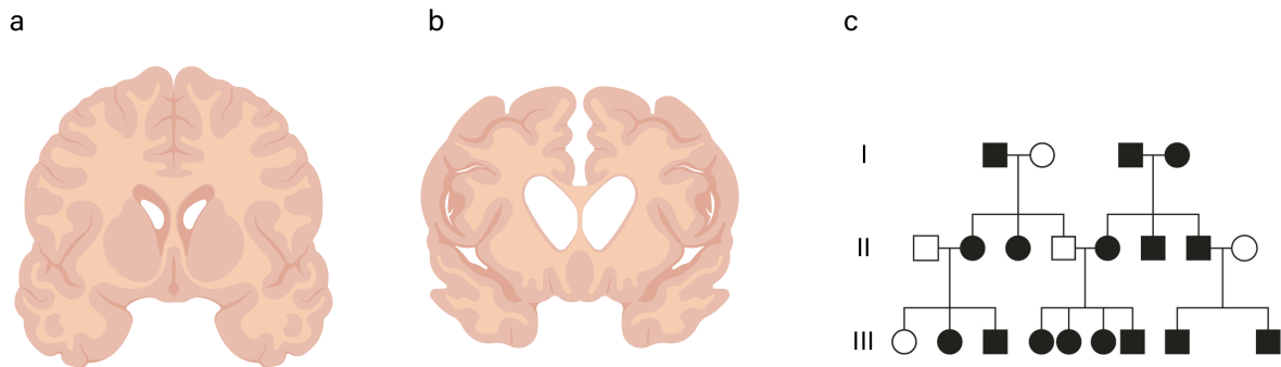
Figur 2. a. Hjerne fra en rask person og b. en patient med Huntingtons sygdom. c. Stamtavle over familie med Huntingtons sygdom. (a og b)

Huntingtons sygdom er en arvelig sygdom, som oftest opstår omkring de 30-55 år. Sygdommen skyldes dannelse af et skadeligt protein, der ødelægger områder i hjernen, som står for muskelkontrol og hukommelse, se figur 2.